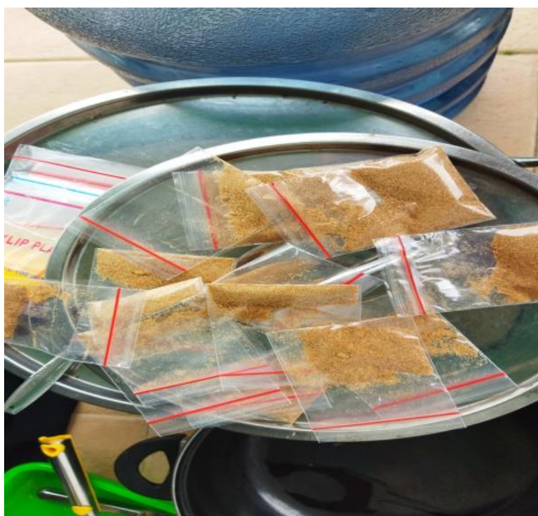
Gambar 4. Bubuk Kaldu

Teknis pelaksanaan penyuluhan yaitu tim pelaksana melakukan pendampingan proses pengolahan berdasarkan resep yang telah dibagikan kepada peserta. Saat terlaksananya pengabdian seluruh peserta sangat antusias dikarenakan ibu-ibu di desa Meureubo telah memahami bahwa kulit udang sangat potensial, praktis dan mudah diolah sebagai produk kaldu bubuk pengganti penyedap rasa sintetis pada masakan ibu-ibu. kemudian ibu-ibu akan berkomitmen untuk tidak membuang lagi limbah kulit udang saat mereka memasak udang