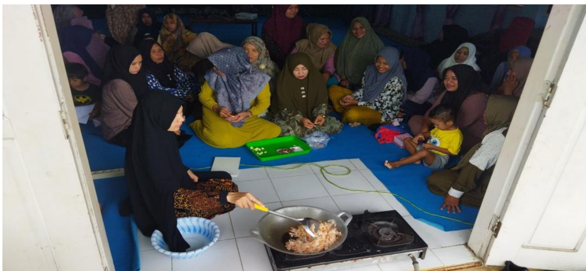
Gambar 5. Proses Sangrai Kulit Udang

Limbah kepala dan kulit udang dapat berfungsi sebagai zat yang layak untuk menggantikan MSG (Hermanto & Nengseh, 2019). Udang yang dikenal karena rasanya yang sedap dan kuat, memiliki esensi lezat dan gurih yang secara langsung mempengaruhi keseluruhan hidangan. Rasa yang terasa dan gurih berasal dari adanya asam glutamat dalam udang (Wisnu et al., 2021). Glutamat dalam udang terbentuk melalui hidrolisis protein yang ditemukan di kepala udang, yang kemudian dikatalisis oleh asam yang ada dalam dekstrin. Proses hidrolitik ini menghasilkan glutamin, yang kemudian mengalami deaminasi untuk membentuk glutamat, menghasilkan rasa gurih (Meiyani et al., 2014). Dengan demikian, udang dapat digunakan sebagai bumbu alami dalam olahan kuliner.