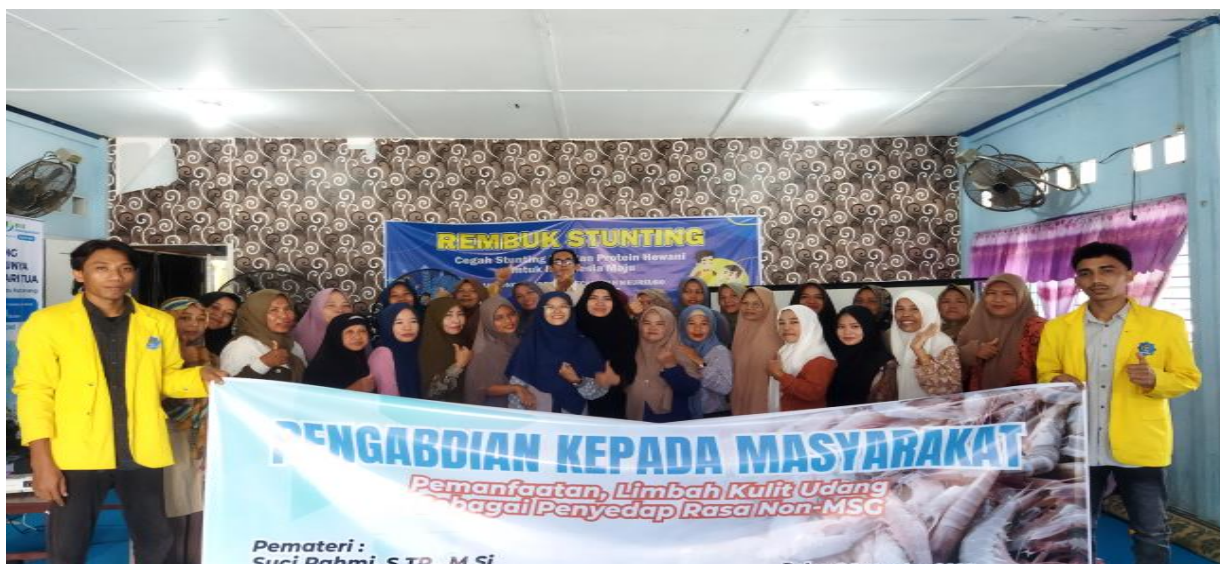
Gambar 7. Sosialisasi Kegiatan