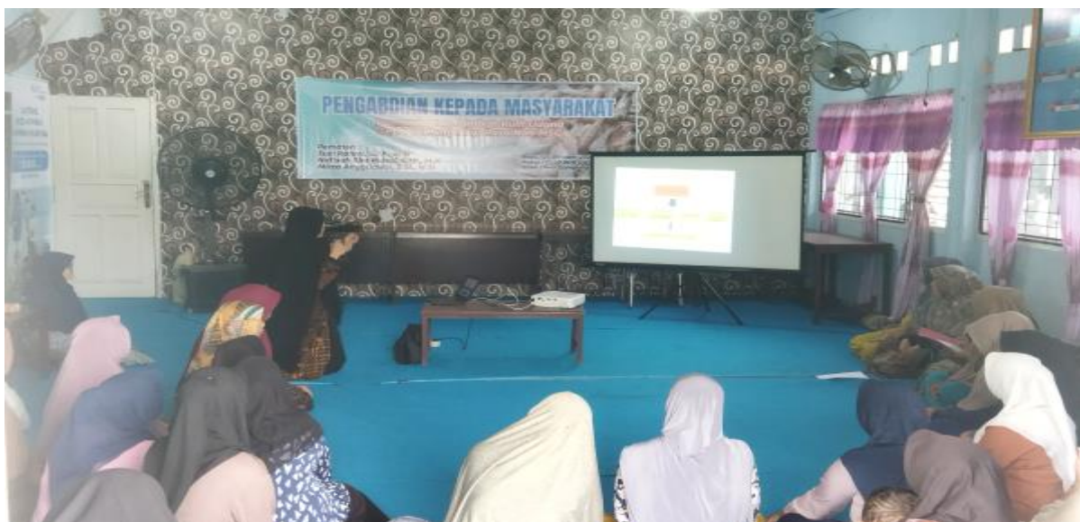
Gambar 2. Kegiatan penyuluhan di Desa Meureubo

Acara penyuluhan diawali dengan pembukaan sambutan dari tim moderator penyuluhan yang kemudian dilanjutkan dengan pemaparan materi oleh pemateri penyuluhan. Pemateri memperkenalkan jenis-jenis udang dan limbah yang sering dihasilkan dari udang. Pemateri juga memaparkan nilai gizi dalam limbah kulit udang. Kulit udang sering kali menjadi limbah yang belum adanya pemanfaatan optimal sehingga pada penyuluhan ini, pemateri menyampaikan bahwa kulit udang mempunyai kandungan gizi yang berpotensi diolah menjadi bubuk kaldu sehat non MSG. Setelah pemaparan materi, kegiatan pengabdian dilanjutkan dengan diskusi tanya-jawab dari peserta penyuluhan seperti tampak pada Gambar 2.