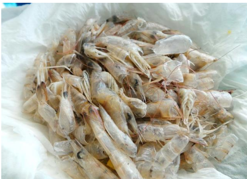
Gambar 3. Limbah Kulit Udang