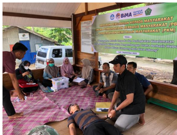
Gambar 2. Praktik Bantuan Hidup Dasar pada Masyarakat

Selama proses pelatihan dan demonstrasi BLS, Tim melakukan dokumentasi berupa foto dan video sebagai bukti bahwa kegiatan telah terlaksana dan berjalan dengan lancar.