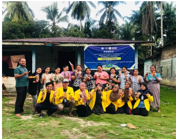
Gambar 4. Foto bersama masyarakat Desa Keras

Gambar 4 menampilkan foto mahasiswa bersama masyarakat saat kegiatan sosialisasi dan pendampingan pengolahan keripik singkong yang dilakukan saat KKN di Desa Keras.