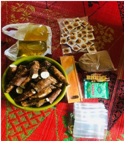
Gambar 2. Alat dan Bahan Pembuatan Keripik Singkong

Melalui kegiatan sosialisasi dan pelatihan ini diharapkan masyarakat paham akan potensi singkong yang besar bila diolah dengan inovasi. Inovasi bisa dari cara mengolah, pengemasan maupun pemasarannya. Kegiatan pengelolaan singkong menjadi keripik merupakan usaha kecil menengah untuk menghasilkan nilai tambah ekonomi. Adanya usaha mikro kecil menengah (UMKM) di Desa Keras dapat meningkatkan pertumbuhan sektor ekonomi masyarakat. Gambar 2 dan 3 menampilkan alat dan bahan yang digunakan serta proses pada pembuatan keripik singkong.