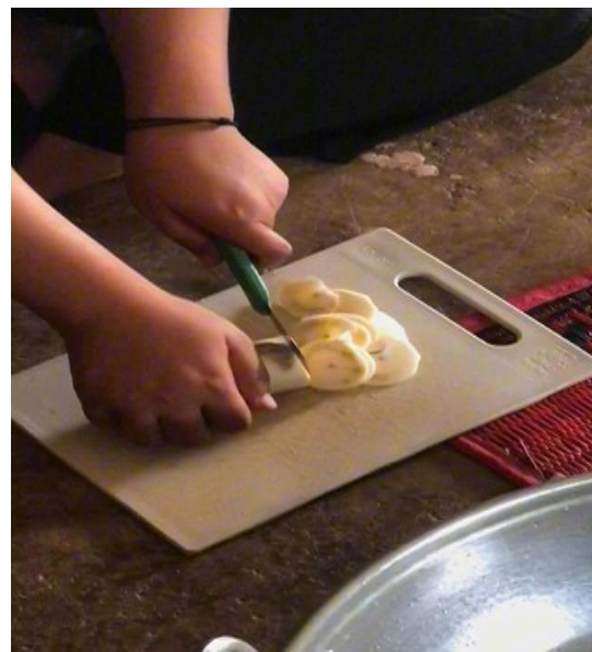
Gambar 3. Proses pemotongan Singkong