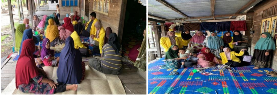
Gambar 4. Sosialisasi dan pelatihan tentang cara mengolah daun pandan duri menjadi produk yang kreatif dan inovatif