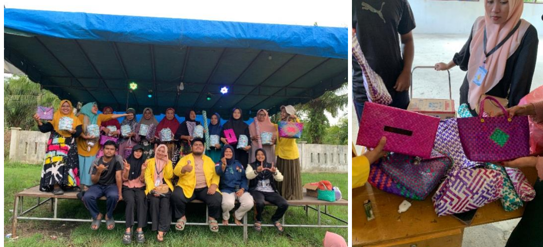
Gambar 5. Hasil produk anyaman daun pandan duri.