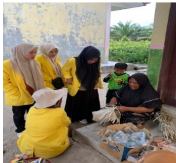
Gambar 2. Diskusi awal untuk mengidentifikasi produk anyaman daun pandan duri

Hasil dari program ini menunjukkan bahwa pemanfaatan sumber daya alam lokal, seperti daun pandan duri, dapat menjadi strategi efektif dalam meningkatkan ekonomi masyarakat pedesaan. Melalui pendekatan partisipatif dan pelatihan yang berkelanjutan, ibu-ibu di Desa Selok Aceh tidak hanya mendapatkan keterampilan baru, tetapi juga mampu menciptakan produk yang inovatif dan bernilai ekonomi tinggi. Keberhasilan program ini juga menunjukkan pentingnya dukungan komunitas dan kerjasama antarwarga dalam mendukung program pemberdayaan ekonomi.