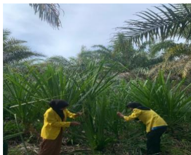
Gambar 3. Proses pengambilan daun pandan duri