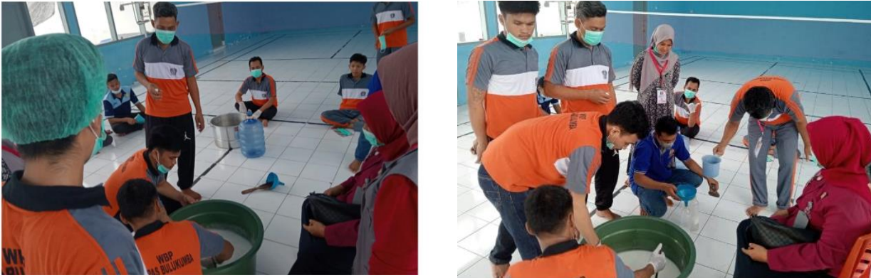
Gambar 2. Proses Pembuatan Sabun

Selanjutnya, menambahkan NaCl 25 g dan EDTA 1 g ke dalam baskom. NaCl yang digunakan berupa garam kristal berwarna putih non yodium yang berfungsi sebagai pengental sabun. Sedangkan EDTA yang digunakan berbentuk bubuk kristal putih yang berfungsi sebagai bahan pengawet sabun. Bahan-bahan tersebut diaduk rata hingga berwarna putih awan. Setelah itu, memasukkan air 450 ml sedikit demi sedikit sambil diaduk. Lalu, menambahkan amphitol sebanyak 10 ml. Amphitol berfungsi sebagai penambah busa/ foam booster . Terakhir, menambahkan pewarna makanan hijau secukupnya sampai warnanya tercampur rata. kemudian mendinginkan sabun selama 24 jam sampai sabun berubah warna menjadi hijau jernih dan sudah dapat digunakan.