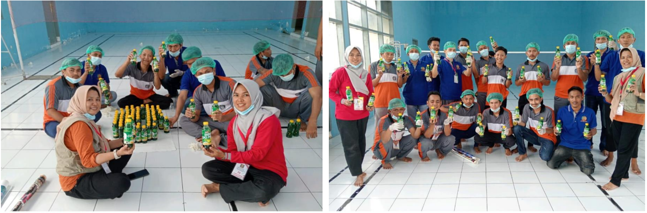
Gambar 3. Foto Bersama Peserta Pelatihan