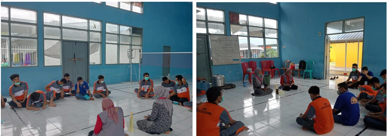
Gambar 1. Identifikasi Kebutuhan Peserta Pelatihan

Pada tahap persiapan, langkah awal yang dilakukan adalah melakukan identifikasi mendalam terhadap kebutuhan pelatihan melalui evaluasi hasil form kuesioner , termasuk menentukan keterampilan khusus yang harus dikuasai oleh peserta serta jumlah narapidana yang akan berpartisipasi dalam program tersebut. Proses ini melibatkan penilaian terhadap latar belakang, minat, dan kemampuan dasar para peserta, sehingga pelatihan dapat disesuaikan dengan kebutuhan dan potensi individu. Setelah itu, dilakukan penyediaan bahan-bahan dan peralatan yang diperlukan untuk pembuatan sabun cuci piring, seperti bahan kimia dasar, alat pengaduk, cetakan, serta perlengkapan keselamatan kerja. Penyediaan ini dilakukan secara teliti untuk memastikan bahwa semua komponen yang dibutuhkan tersedia dalam jumlah yang memadai dan berkualitas baik, guna mendukung kelancaran dan efektivitas pelatihan.