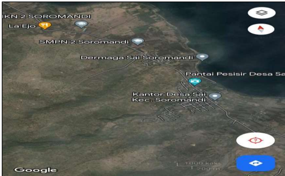
Gambar 1 Peta Lokasi Penelitian Desa Sai