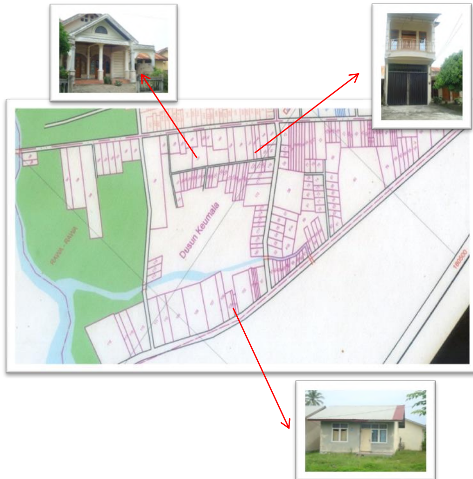
Gambar 1 Jenis kondisi bangunan pada Dusun Kemala