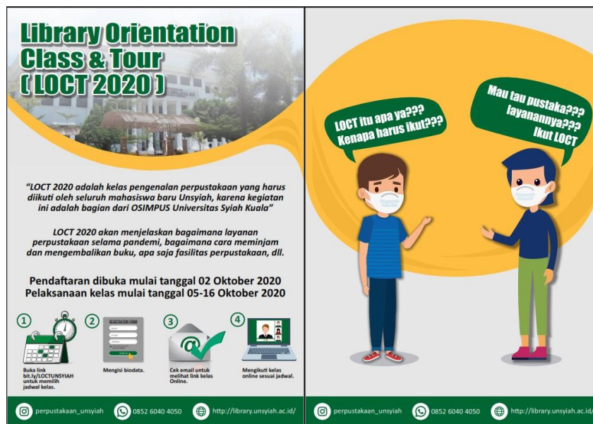
Gambar 3. Library Orientation Class and Tour pada Masa Pandemi