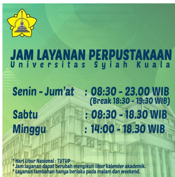
Gambar 1. Jadwal Layanan UPT Perpustakaan Universitas Syiah Kuala

UPT Perpustakaan Universitas Syiah Kuala memiliki visi yaitu menjadi pusat informasi ilmiah yang menginspirasi dan memotivasi pencapaian visi dan misi Universitas Syiah Kuala. Sedangkan misi dari UPT Perpustakaan Universitas Syiah Kuala antara lain: menjaga relevansi koleksi dengan kebutuhan pemustaka, menciptakan loyalitas pemustaka dengan layanan prima. menumbuhkan motivasi dan inspirasi pemustaka untuk berinovasi dan berkreatifitas dengan fasilitas dan kegiatan dalam bidang literasi informasi, mengembangkan repository lokal konten yang open akses, mengembangkan kompetensi sumber daya manusia yang bersertifikasi, mengembangkan aplikasi teknologi informasi perpustakaan sesuai standar, mengembangkan tata kelola manajemen perpustakaan sesuai standar menjalin kerjasama dengan institusi lain dalam pengembangan layanan dan operasional perpustakaan serta tanggung jawab sosial kepada masyarakat dalam bidang literasi informasi ( library.unsyiah.ac.id ).