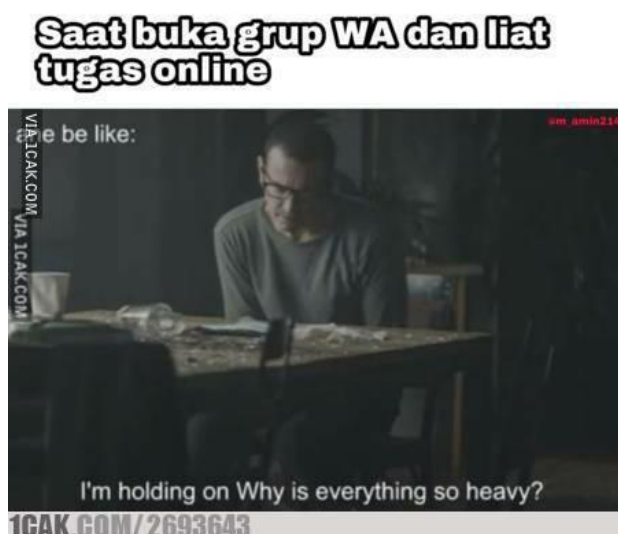
Gambar 1.1 Meme masalah perkuliahan online

Meskipun dianggap lebih mudah dalam menjalankan PJJ, namun kemandirian, kemampuan belajar, dan kemampuan adaptasi mahasiswa sangat diuji. Sejak PJJ dan kuliah daring diterapkan, bermunculan meme yang menjelaskan situasi mahasiswa saat menjalani perkuliahan. Misalnya saja sebuah meme unik yang menyebar di lingkungan mahasiswa dalam menggambarkan keluhan saat PJJ.