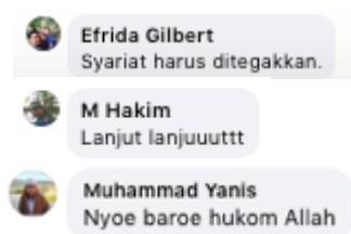
Gambar 4. Tangkapan Layar Tema 4

Keempat, pro syariat Islam dan hukum cambuk. Di sisi lain, publik juga banyak memberikan opini netral dan cenderung positif terkait tautan berita eksekusi hukum cambuk di fan page Serambinews.com. Opini ini berisikan dukungan publik terhadap Pemerintah Aceh dalam menerapkan syariat Islam. Hal ini tentunya berkontribusi dalam mendukung pelaksanaan syariat Islam di Aceh.