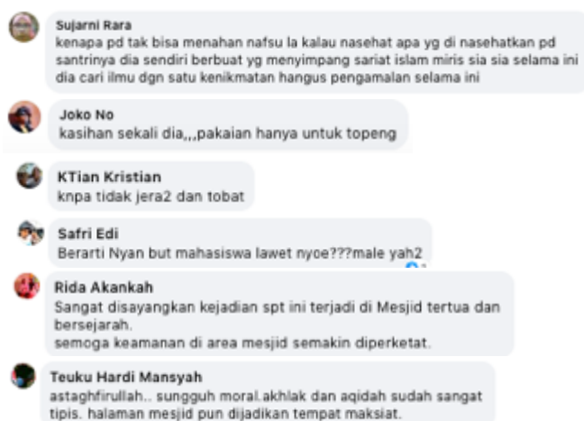
Gambar 3. Tangkapan Layar Tema 3

menahan hawa nafsu, publik menyarankan adanya upaya memperketat penjagaan masjid, dan sebagainya.