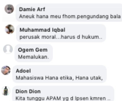
Gambar 2. Tangkapan Layar Opini Publik Tema 2

Kedua, umpatan. Tema dominan yang kedua ini lebih banyak ditemukan dalam tautan berita khalwath dan ikhtilath . Beberapa publik mengekspresikan kekesalan, kemarahan, serta ketidaksukaan mereka terhadap terpidana dengan melontarkan umpatan menggunakan nama hewan. Selain itu, publik juga membubuhi predikasi 'haramjadah', 'pengundang bala', dan 'perusak moral' kepada terpidana baik laki-laki dan perempuan.