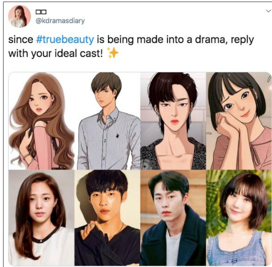
Gambar 3. Tweet @kdramasdiary Untuk Dream Cast #TrueBeauty