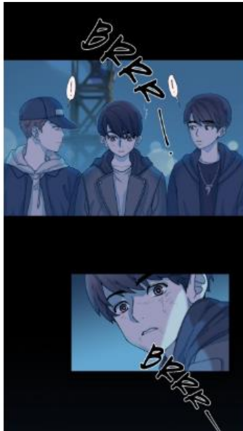
Gambar 1. Bentuk Vertikal Tampilan LINE Webtoon (LICO, 2019)