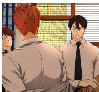
Gambar 3. Bentuk Seri LINE Webtoon yang Disiipkan Musik di Dalamnya (Quimchee, 2018)