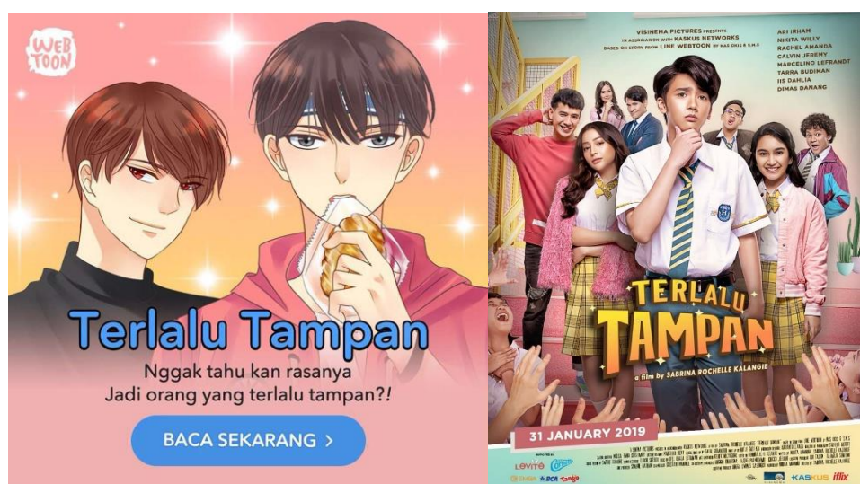
Gambar 4. Perbandingan Poster Webtoon “Terlalu Tampan” Antara LINE Webtoon dengan Versi Adaptasi (Whafsahm, 2019)

“Terlalu Tampan” menjadi fenomena baru di Indonesia, dimana menjadi hasil karya Webtoon pertama yang berhasil mengalami adaptasi. Sementara bentuk adaptasi ke dalam film di Indonesia kebanyakan berasal dari novel yang sudah dilakukan sejak 1926 dengan dengan judul “Loetoeng Kasaroeng” (Djaya, 2015).