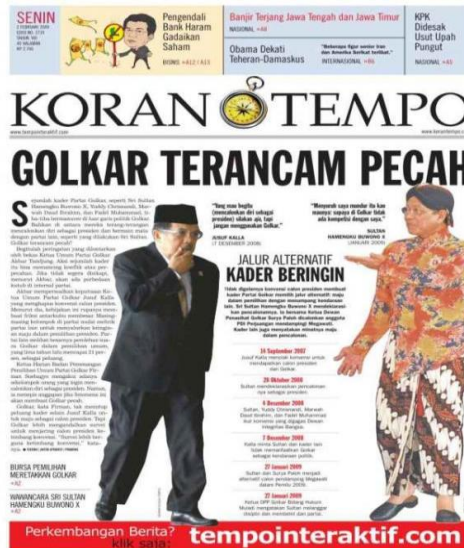
Gambar: Tampilan Koran Tempo Cetak & Online

Lebih lanjut dampak dari konvergensi tersebut ternyata amatlah besar untuk mengubah ciri-ciri komunikasi massa konvensional, seperti media cetak. Dalam hal umpan balik misalnya, yang biasanya pada media cetak selalu tertunda akan berkurang bahkan mungkin bisa saja akan lenyap sama sekali. Dan jika dikaitkan dengan kepentingan-kepentingan kelompok tertentu, maka keberadaan media yang konvergen akan dimanfaatkan untuk menyebarkan gagasan-gagasan politik secara lebih leluasa dibandingkan dengan media cetak yang konvensional, sehingga perhatian pun akan menjadi lebih besar ditujukan pada media yang konvergen tersebut. Media Tempo juga akan dengan mudahnya menyebarkan kepentingannya melalui pemanfaatan teknologi dan internet tersebut, baik kepentingan bisnis media atau kepentingan lainnya yang menguntungkan tokoh politik tertentu.