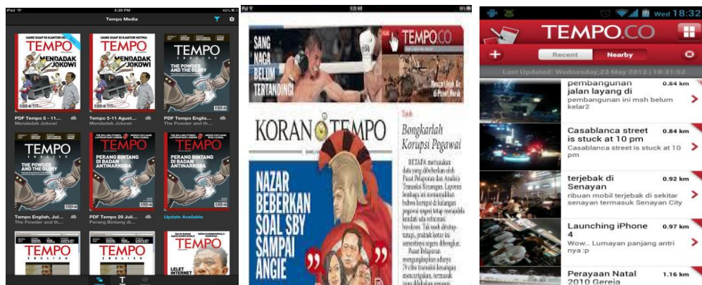
Gambar : Majalah Tempo di Tablet, Tempo.co, dan Koran Tempo di Android

Inovasi adalah penting dalam proses konvergensi media. Dengan berkembangnya teknologi maka pembaca juga akan mengikuti tren teknologi seperti penggunaan gadget dan mulai meninggalkan media cetak. Tempo Media Group memanfaatkan perkembangan teknologi informasi dan komunikasi tersebut dengan memaksimalkan aplikasi Tempo digital yang dapat diakses dengan mudah di Ipad dan Smartphone atau mendownload aplikasi Koran Tempo di Android Playstore. Dengan inovasi yang telah gencar dilakukan oleh Tempo Media Group tersebut, maka khalayak saat ini tidak hanya dapat menikmati informasi terkini khas Tempo melalui kanal-kanal berita pilihan, seperti Bisnis, Metro, Politik, Dunia, Bola, Olahraga, Otomotif, Gaya, Seleb, Travel, tetapi juga suguhan infografik yang menarik serta tampilan audio dan video yang memikat.