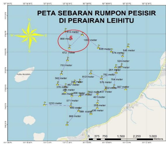
Gambar 7 Kelompok rumpon 5 armada tangkap

Bagian terjauh dan menghadap langsung Selat Kelang terdapat rumpon kelompok 5. Kelompok rumpon ini memiliki jumlah rumpon paling sedikit dari kelompok lain dan memiliki jarak yang cukup jauh dari kelompok rumpon yang ada. Jarak rumpon pada kelompok 5 berjarak 613 meter sampai 1002 meter. (Gambar 7)