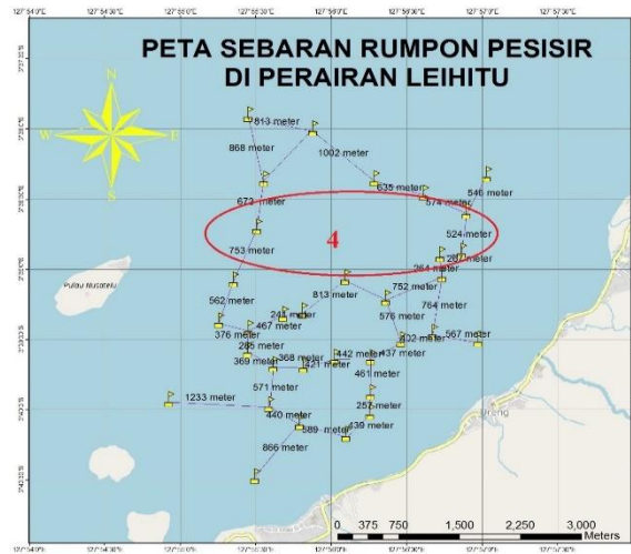
Gambar 6 Kelompok rumpon 4 armada tangkap

Pada bagian perairan yang lebih luas berada dalam posisi menghadap Pulau Tiga serta Selat Kelang terdapat kelompok rumpon 4. Rumpon kelompok ini memiliki jarak antara satu rumpon dengan rumpon yang lain berjarak 542 meter sampai 672 meter dengan jumlah rumpon cukup banyak dan tersebar merata. (Gambar 6)