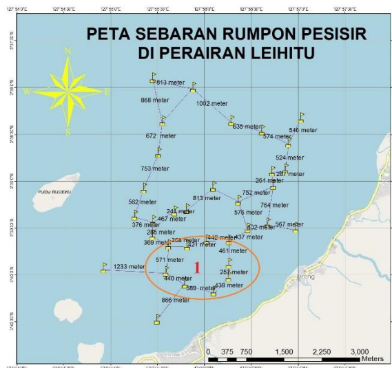
Gambar 3 Kelompok rumpon 1 armada tangkap

Rumpon yang tersebar dan membentuk kelompok 1 merupakan rumpon yang menghadang ikan masuk dari arah pulau 3 (Asilulu) selanjutnya akan tertahan dan terjebak dalam lingkaran rumpon. Banyaknya pulau dan kuatnya sirkulasi air keluar masuk teluk membuat ikan merasa nyaman berada dalam kurungan rumpon. Kelompok rumpon 1 memiliki jarak antara 1 rumpon dengan rumpon yang lain berkisaran 257 meter sampai 1233 meter ( Gambar 3).