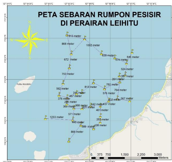
Gambar 2 Rumpon armada tangkap

yang ada. (Nurdin et al., 2018) menyatakan factor oceanografi sangat berpengaruh terhadap hasil tangkapan di sekitar rumpon.