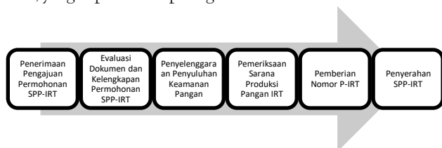
Gambar 2. Prosedur Penerbitan SPP-IRT

regulasi ini merupakan pedoman bagi pemerintah kabupaten/kota melalui perangkat daerah terkait yang bertugas untuk melakukan tugas ini. Berdasarkan pedoman yang diberikan oleh BPOM RI, di Pemerintah Kabupaten Tanah Datar, tidak mempunyai langkah yang berbeda dengan yang diatur dalam regulasi. Terdapat tahapan dalam pemberian SPP-IRT, yang dapat dilihat pada gambar 2 berikut: