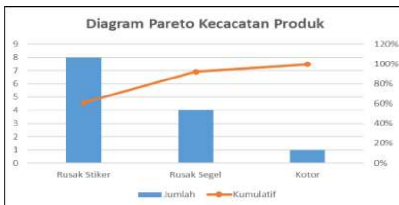
Gambar 2. Diagram Pareto

Hasil CTQ ini kemudian dikonversi ke diagram pareto untuk menentukan menentukan jenis kecacatan yang dominan dan tindakan prioritas perbaikan yang harus dilakukan [16]. Berikut diagram pareto pada IKM Nozy Juice.