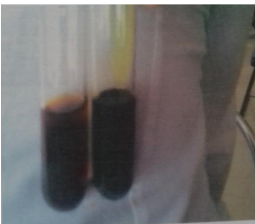
Gambar 6. Perbandingan kedua tabung setelah satu tabung di tambahkan FeCl_3

Hasil penelitian menunjukkan bahwa daun belimbing wuluh yang telah digerus kemudian ditambahkan methanol dan disaring setelah itu di bagi menjadi dua bagian dimasukkan ke dalam tabung reaksi, ke dalam salah satu tabung di tambahkan besi (III) klorida dan diamati perubahan warna pada sampel, warna sampel berubah menjadi warna biru kehitaman, ini mengindikasikan bahwa di dalam sampel tersebut mengandung senyawa tannin. Hal ini sesuai dengan penelitian terdahulu yang menyatakan bahwa penyemprotan dengan menggunakan besi (III) klorida pada tanin terhidrolisis menampakkan bercak berwarna biru kehitaman dan pada tanin terkondensasi menampakkan bercak hijau kecokelatan [8].