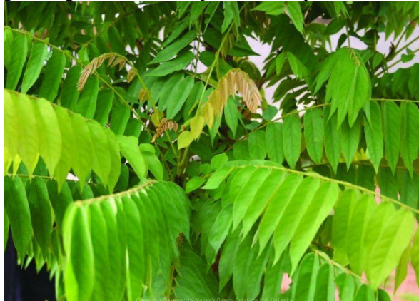
Gambar 1. Daun Belimbing Wuluh

Daun belimbing wuluh mempunyai aktifitas farmakologi yaitu untuk menghilangkan rasa nyeri dan sebagai antiinflamasi. Pada tanaman Belimbing wuluh memiliki kandungan kimia yaitu kalium oksalat, flavonoid pectin, tanin, asma galat dan asam ferulat. Tanaman ini banyak dimanfaatkan mengatasi berbagai penyakit seperti batuk, diabetes, rematik, gondongan, sariawan, sakit gigi, gusi berdarah, jerawat, diare sampai tekanan darah tinggi. Ekstrak daun belimbing wuluh mengandung flavonoid, saponin, triterpenoid dan tanin [1-2]