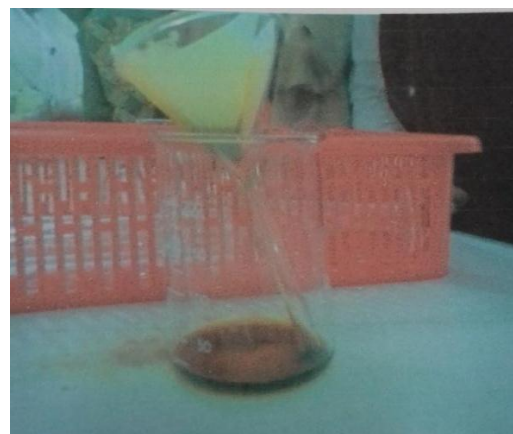
Gambar 4. Daun Belimbing Wuluh Yang disaring