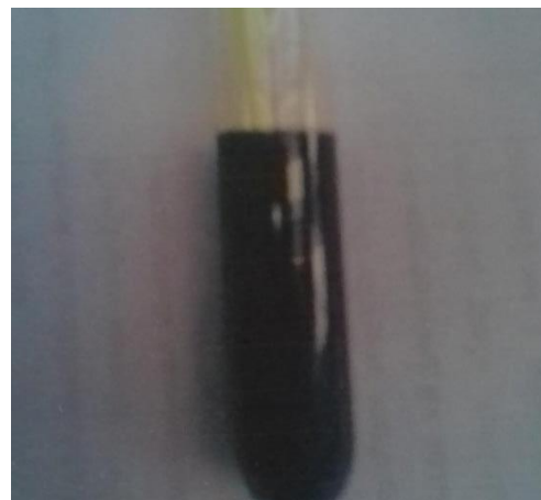
Gambar 7. Larutan terbukti mengandung senyawa Tanin