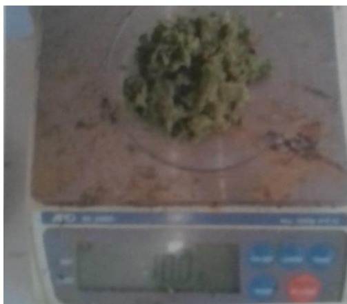
Gambar 3. Daun Belimbing Wuluh Yang telah digerus

Daun belimbing wuluh yang telah digerus dalam lumpang, kemudian di timbang sebanyak 10 gram, kemudian dimasukkan ke dalam cawan penguap, dimasukkan methanol sebanyak 10 mL ke dalam daun belimbing wuluh yang telah digerus, setelah itu diambil ekstrak dari daun belimbing tersebut dan disaring ke dalam gelas kimia, kemudian di bagi menjadi 2 tabung reaksi. Pada salah satu tabung reaksi di teteskan larutan \text{FeCl}_3 sebanyak 2 tetes, namun tabung reaksi lainnya masih tetap berwarna hijau kemudian di perhatikan perubahan yang terjadi pada sampel yang ditetaskan larutan \text{FeCl}_3 .