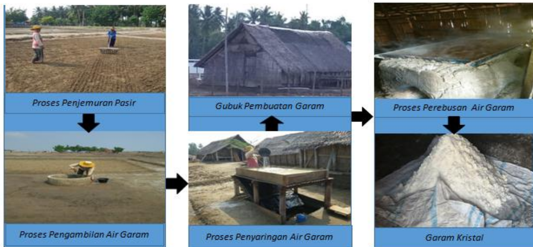
Gambar 3. Proses Produksi Garam Tradisional di Desa Keude Ie Leubeu, Kabupaten Pidie

Adapun gambaran secara umum dari proses produksi garam tradisional di Desa Keude Ie Leubeu, Kabupaten Pidie dapat dilihat dari Gambar 3 berikut ini.