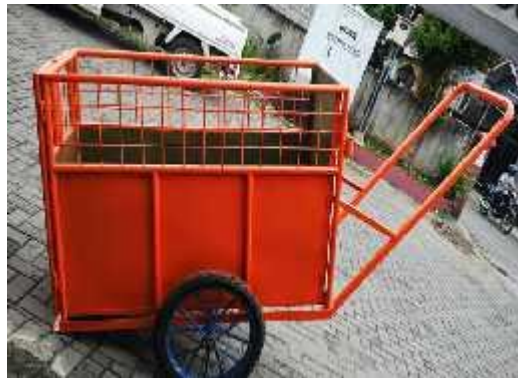
Gambar 2. Gerobak Sampah

Densitas untuk gerobak sampah sebesar 0,25 - 0,40 \text{ ton/m}^3 maka kapasitas gerobak untuk mengangkut sampah sebesar :