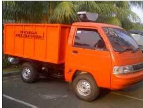
Gambar 3. Pick Up Truck

Densitas untuk pick up truck sebesar 0,30 – 0,40 ton/m 3 maka kapasitas pick up untuk mengangkut sampah sebesar :