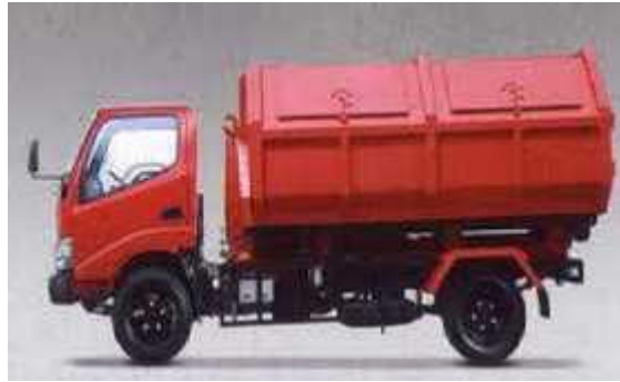
Gambar 4. Arm-roll Truck

Densitas untuk Arm-roll Truck sebesar 0,30 - 0,40 \text{ ton/m}^3 maka kapasitas Arm-roll Truck untuk mengangkut sampah sebesar :