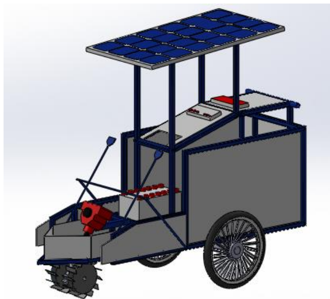
Gambar 2. Mesin panen padi mini sesudah didesain ulang

Mesin panen padi yang telah didesain ulang pada penelitian ini telah menggunakan roda penggerak yang berada didepan mesin panen padi berjumlah dua roda penggerak dan berfungsi untuk menggerak mesin panen padi, tampak desain mesin panen padi yang telah dimodifikasi pada penelitian ini ditunjukkan pada Gambar 2.