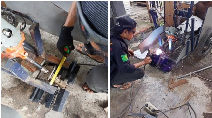
(a) Pengaturan dudukan motor (b) pengaturan dudukan roda penggerak Gambar 3. Pengaturan Dan Pemasangan Roda

Pengaturan dudukan motor bakar dua tak dengan menggunakan dudukan motor yang terbuat dari besi siku dan besi plat, disambungkan dengan rangka utama mesin panen padi menggunakan sambungan las ditunjukkan pada Gambar 3.(a). dan sambungan roda penggerak dikoneksikan pada motor dua tak menggunakan poros fleksibel, dudukan roda penggerak di rangka utama menggunakan sambungan las dan sambungan baut, seperti ditunjukkan pada Gambar 3(b).