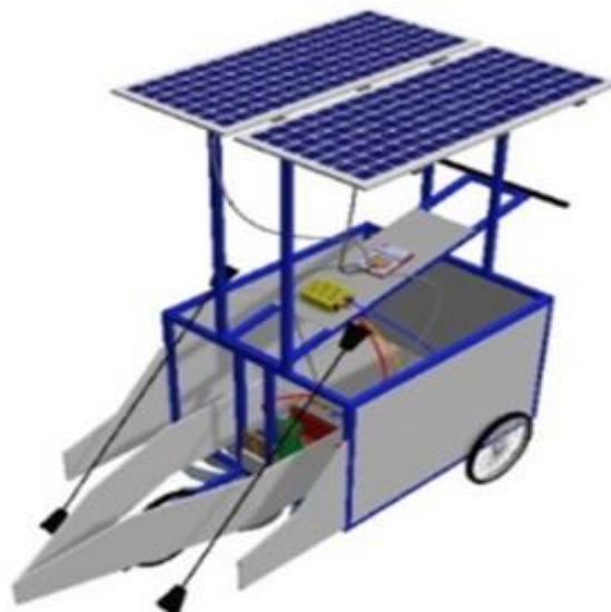
Gambar 1. Mesin panen padi mini sebelum didesain ulang