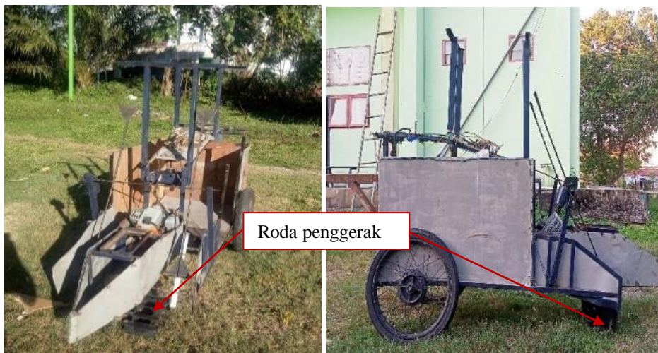
(a) Tampak depan roda penggerak (b) Tampak samping roda penggerak Gambar 4. Tampak akhir roda penggerak pada mesin panen padi

Hasil manufaktur roda penggerak pada mesin panen padi dua lajur dengan sumber daya dari motor bakar dua tak ditunjukkan pada Gambar 4.(a) Tampak depan roda penggerak dan 4.(b) Tampak samping kanan roda penggerak