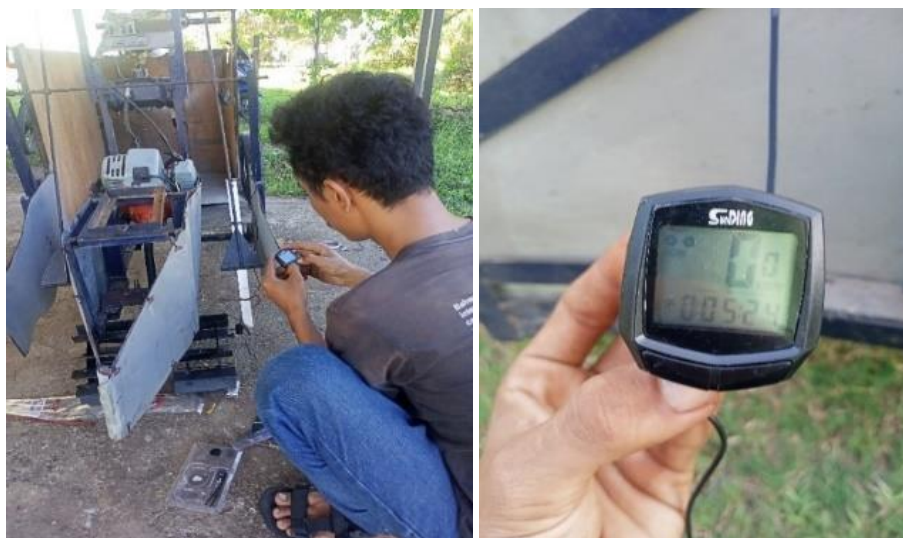
(a) Pengaturan speedometer pada roda penggerak (b) Tampilan monitor speedometer Gambar 8. Proses pengaturan speedometer digital

Hasil pengaturan speedometer digital diketahui diameter roda (yang akan diuji kecepataannya) dan diketahui diameter roda penggerak adalah 21 centimeter (cm) dan dikonversikan ke milimeter (210 mm), dan dikalikan ( \times ) 3.14 ( \phi ) dan dihasilkan 659,4 mm. Lalu dilakukan pemasukan hasil besaran ke monitor speedometer digital. Proses pengaturan speedometer ditunjukkan pada Gambar 8.