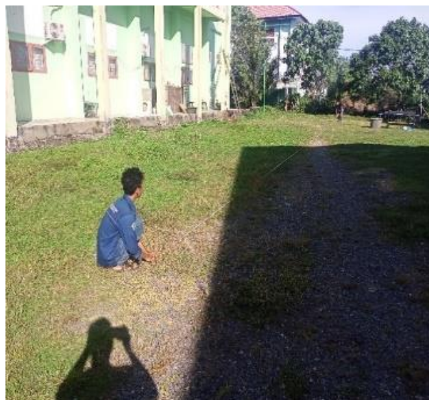
Gambar 6. Proses persiapan jalur lintasan pengujian roda penggerak

Ada dua lintasan yang dilakukan dalam pengujian roda penggerak ini antara lain di lahan kering dan pengukuran ini dilakukan sebagai penentuan jarak pengujian roda penggerak dan masing-masing sampel berjarak sejauh 50 meter. Ditunjukkan pada Gambar 6