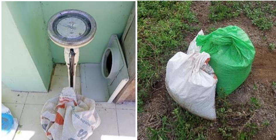
(a) Proses penimbangan media beban angkut (b) Media angkut yang telah ditimbang Gambar 7. Proses persiapan beban angkut mesin panen padi

Tiga kategori beban yang digunakan pada pengujian kemampuan gerak mesin panen padi diisi dengan beban 40 kg, 80 kg dan 120 kg, menggunakan media pasir yang diisi dalam karung kemudian ditimbang dengan menggunakan timbangan berat, proses persiapan beban angkut mesin panen padi ditunjukkan pada Gambar 7.