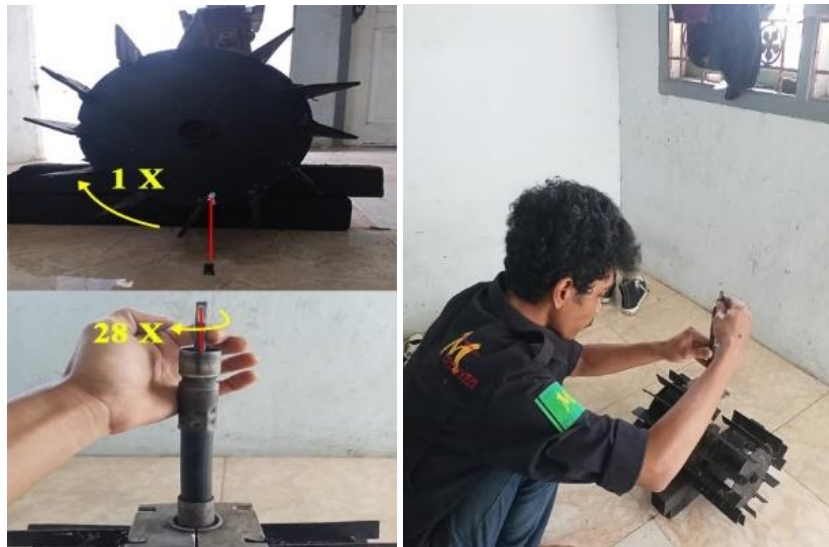
Gambar 5. Proses Pengukuran Rasio Roda Penggerak

Dalam pengukuran ini didapat hasil perbandingan putaran roda penggerak dengan rasio 1:28. Dimana 1 kali putaran roda membutuhkan 28 kali putaran dari poros penggerak. Proses pengukuran rasio roda penggerak ditunjukkan pada Gambar 5.