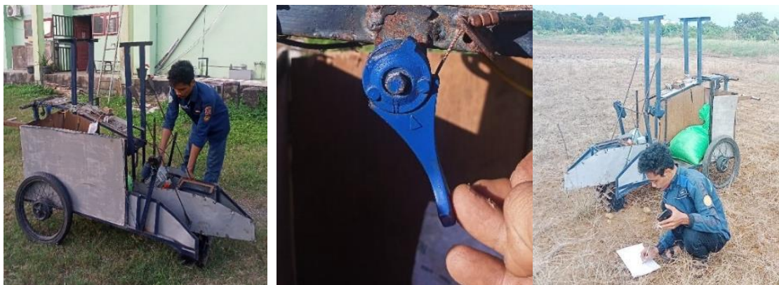
(a) Menghidupkan engine (b) pengaturan power engine (c) pengambilan data uji Gambar 9. Pengujian roda penggerak pada lahan kering

Proses pengujian roda penggerak pada mesin panen padi dilintasan lahan kering dilakukan dengan variasi beban 40 kg, 80 kg dan 120 kg, dengan tahapan awal menghidupkan motor bakar, meletakkan beban pada rumah angkut, mengatur power engine \frac{1}{2} (3500 rpm), \frac{3}{4} (5250 rpm) dan full power engine (7000rpm), kemudian dilanjutkan dengan pengambilan data kecepatan gerak dan waktu tempuh mesin panen padi pada jarak 50 meter. Proses tersebut ditunjukkan pada Gambar 9.