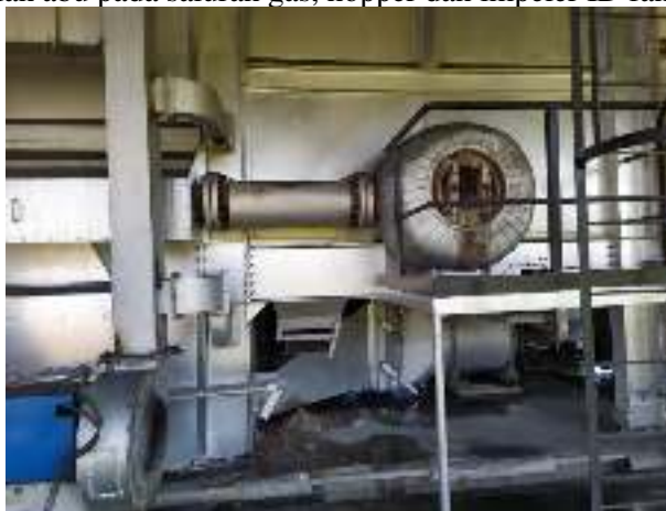
Gambar 7. Komponen ask hopper[1].

f. Pengecekan kumpulan abu pada saluran gas, hopper dan impeler ID fan.