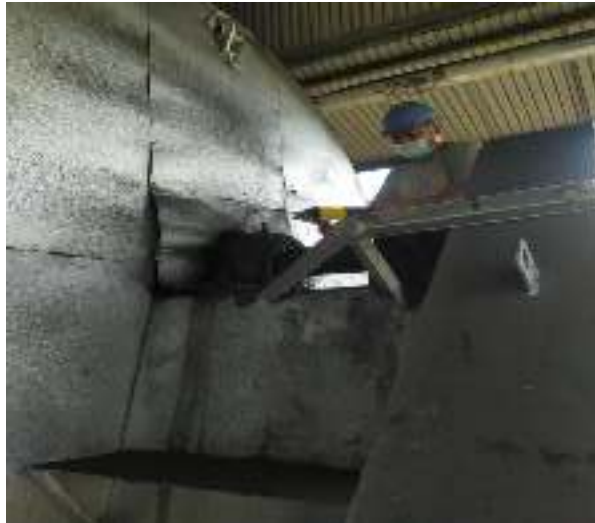
Gambar 8. Proses penambahan pelumas[1].