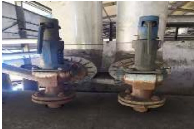
Gambar 5. Komponen safety valve[1].