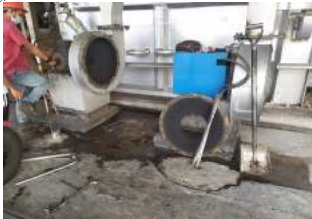
Gambar 9. Proses pengecekan bearing secondary air fan[1].