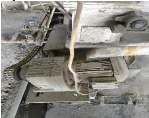
Gambar 6. Komponen gear motor[1].

f. Pengecekan kumpulan abu pada saluran gas, hopper dan impeler ID fan.