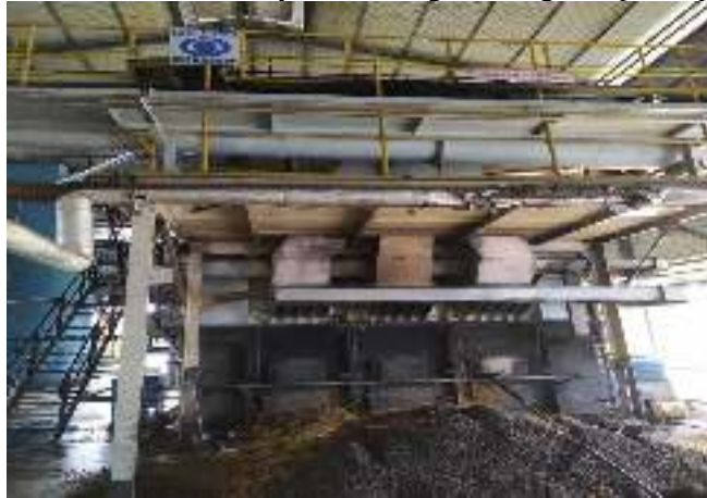
Gambar 3. Unit Boiler di PT. Beurata Subur Persada.

mencapai 80% dari total semua alat yang dipakai. Kualitas uap yang dihasilkan cukup memberikan pengaruh yang signifikan terhadap kualitas produk yang dihasilkan, sehingga apabila batas minimum persyaratan uap yang mesti dihasilkan berkurang akan berakibat tidak baiknya hasil yang dihasilkan serta tentunya akan sangat merugikan pihak perusahaan[10].