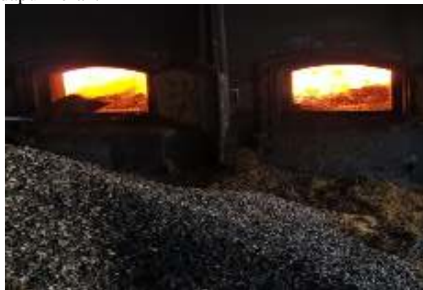
Gambar 4. Ruang dapur kerak[1].