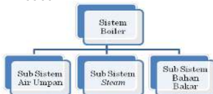
Gambar 2. Kinerja boiler.

Pada sebuah sistem ketel uap (boiler), kesiapan dan penkondisian alat perlu diperhatikan agar memenuhi target produksi yang telah direncanakan[2]. Efisiensi yang baik perlu dijaga pada sebuah ketel uap (boiler), dengan cara melakukan inspeksi dan pengecekan secara berkala terhadap komponen-komponen didalam boiler[3]. Kerusakan-kerusakan atau faktor-faktor penurunan performa dari ketel uap (boiler) dapat terjadi seperti adanya pembentukan terak-terak atau kotoran-kotoran yang tersisa didalam pipa-pipa didalam boiler tersebut[4]. Pembentukan kotoran-kotoran tersebut dapat menjadi penghambat bagi panas dalam memanaskan air baku yang diubah menjadi uap, sehingga panas tidak terdistribusi dengan baik dan bisa kemungkinan terjadi kelebihan panas pada salah satu sisi boiler[2]. Kemudian dari pada itu, sebuah boiler juga berfungsi sebagai alat vital dalam sebuah pabrik pengolahan minyak mentah kelapa sawit (CPO). Untuk menjaga kualitas dan jumlah produksi dari sebuah pabrik kelapa sawit tersebut, sebuah unit boiler harus mampu menghasilkan uap sesuai dengan kebutuhan pabrik dalam mencapai target produksi[5]–[7].