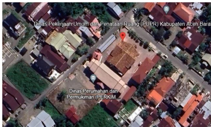
Gambar 1. Peta Kawasan Penelitian

Penelitian ini berada di Desa Drien Rampak, Kecamatan Johan Pahlawan, Kabupaten Aceh Barat. Penelitian ini dilakukan pada proyek Pembangunan Gedung Olah Raga.