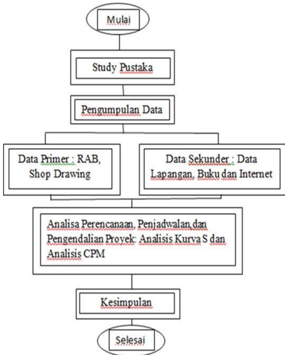
Gambar 2. Bagan Alur Penelitian