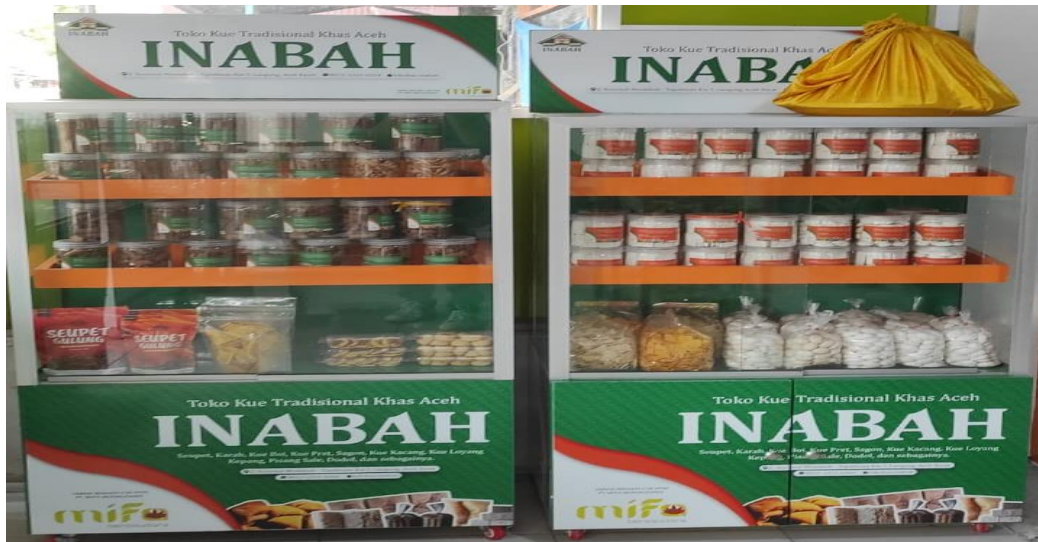
Gambar 3. Etalase Produk UMKM Inabah

Peneliti kembali menanyakan pertanyaan terakhir dari indikator Keterlibatan Finansial dengan pertanyaan “Bagaimana Anda meyakinkan pelanggan bahwa harga yang Anda tetapkan mencerminkan kualitas dan nilai produk atau layanan Anda, sehingga menghasilkan keterlibatan finansial yang tinggi dari pelanggan?” Informan menanggapi dengan jawaban sebagai berikut: