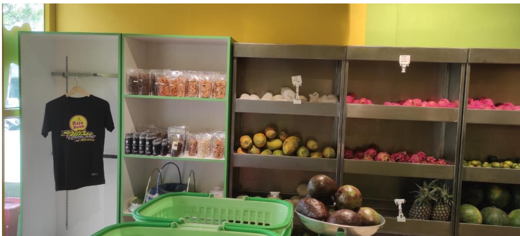
Gambar 1. Etalase Buah-Buahan UMKM Raja Buah

Para pelaku UMKM tersebut menyadari bahwa keterlibatan emosional yang rendah dapat mempengaruhi keputusan pembelian konsumen. Mereka mengatasi hal ini dengan berbagai cara, seperti (1) Menjaga kualitas produk dan pelayanan, (2) Melakukan interaksi personal dengan pelanggan, (3) Menggunakan media sosial untuk komunikasi dan promosi, (4) Menyampaikan cerita dan nilai-nilai produk kepada pelanggan, (5) Membuat acara dan aktivitas yang melibatkan pelanggan, dan (6) Menjaga kualitas bahan yang digunakan. Dengan strategi-strategi ini, para pelaku UMKM berusaha untuk membangun dan meningkatkan keterlibatan emosional pelanggan terhadap produk dan merek mereka, yang pada akhirnya dapat meningkatkan loyalitas dan kepuasan pelanggan.