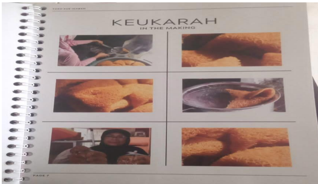
Gambar 2. Katalog Produk UMKM Inabah

Hasil wawancara di atas mengungkapkan bahwa UMKM di Kota Meulaboh menggunakan berbagai strategi pemasaran untuk mempertahankan kualitas produk dan pelayanan guna mempengaruhi keputusan pembelian konsumen produk high involvement . Strategi yang digunakan meliputi pemanfaatan media sosial, partisipasi dalam kegiatan UMKM, dan interaksi langsung yang ramah dan personal dengan pelanggan. Para pelaku UMKM, seperti Raja Buah, Bang Khan, dan Ngoh Benk, menekankan pentingnya membangun ikatan emosional melalui pelayanan yang baik dan komunikasi yang berkelanjutan dengan pelanggan. Selain itu, berbagai program loyalitas dan promo khusus, seperti diskon, hadiah gratis, dan event-event komunitas, juga digunakan untuk meningkatkan keterlibatan emosional pelanggan.