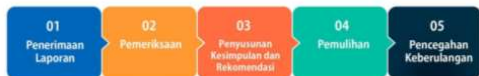
Gambar 1. Tahapan Penanganan Perkara PPKS

Buku Panduan, menurut Pasal 38, Permendikbudristek Nomor 30 Tahun 2021 bahwa penanganan ada 5 (lima) tahapan pelaksanaan penanganan perkara terdiri dari 15 :