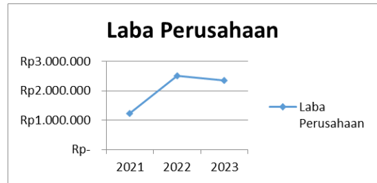
Gambar 2. Grafik laba PT Mitra Adiperkasa 2021-2023

boikot dari seluruh dunia, tentu saja menjadi ancaman bagi PT Mitra Adiperkasa. Apalagi dua merek besar mereka Starbucks dan Zara yang paling besar kecamannya terhadap boikot. Maka rumusan masalah dalam penelitian ini bagaimana kinerja keuangan PT Mitra Adiperkasa melalui analisis rasio keuangan. Tujuan penelitian ini adalah untuk mengetahui kinerja keuangan PT Mitra Adiperkasa dengan menggunakan rasio keuangan.