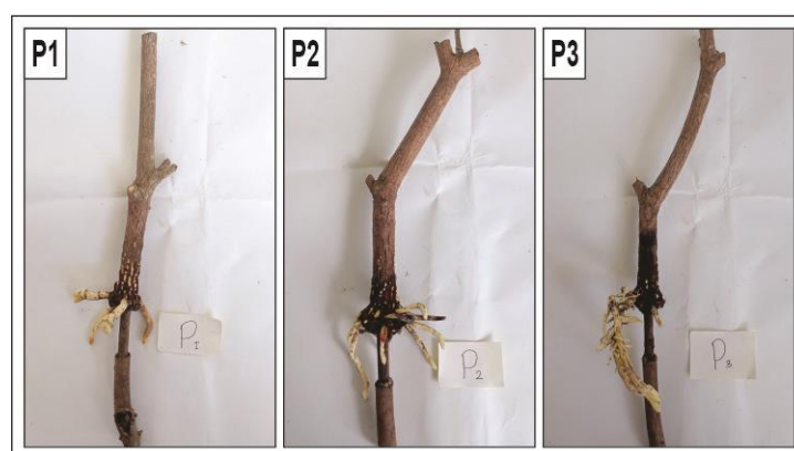
Gambar 2. Akar cangkok sawo umur 4 bulan setelah pencangkokan: pembungkus media sabut kelapa (P 1 ), pembungkus media plastik bening (P 2 ), pembungkus media polybag (P 3 ).

yang berserabut dan memiliki pori-pori yang besar dan aerasinya mudah keluar masuk, setiap harinya harus dilakukan penyiram pada saat musim kemarau (Feriady et al. , 2020). Ada berbagai faktor yang dapat mempengaruhi kejadian tersebut yaitu proses pencangkokan dilakukan pada saat musim kemarau sehingga pembungkus pada perlakuan sabut kelapa media di dalamnya cepat mengering sehingga mengurangi daya perangsangan muncul akar, sedangkan pada perlakuan plastik bening kelembaban media lebih terjaga karena aerasinya terjaga (Hasriani et al. , 2013),