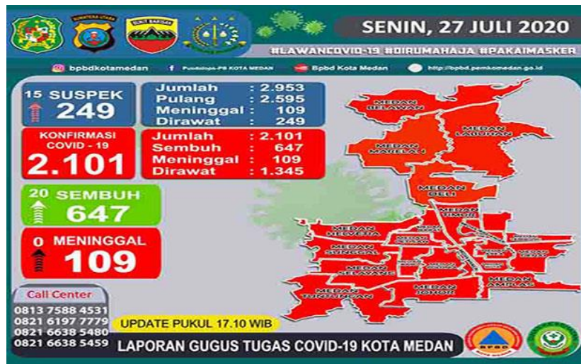
Gambar 1. Peta COVID-19 Kota Medan (Update 27 Juli 2020)

pada SKB 4 menteri tentang penyelenggaraan pembelajaran pada tahun ajaran 2020/2021 pada saat pandemi COVID-19, maka satuan pendidikan atau sekolah yang berada di kota Medan tidak diperkenankan melakukan proses pembelajaran secara tatap muka. Mengikuti aturan pemerintah tersebut maka SD Swasta Harapan 3 Medan saat pandemi COVID-19 melakukan proses pembelajaran secara daring.