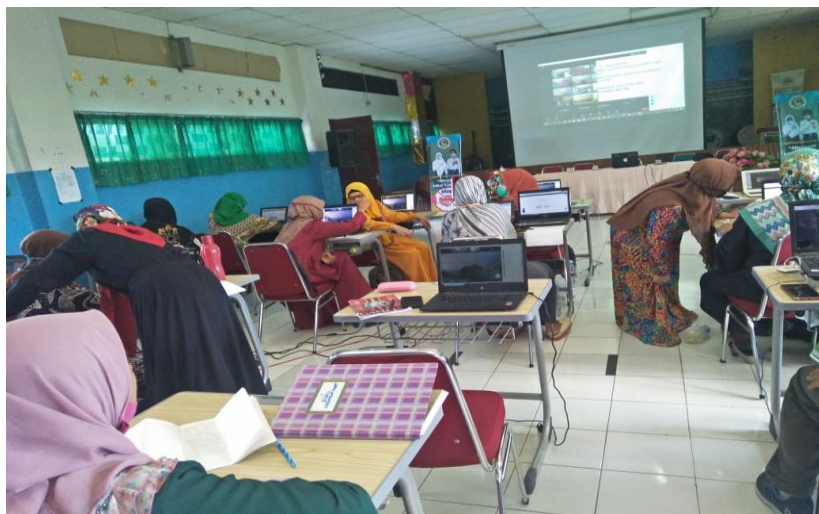
Gambar 4. Peserta Melakukan Praktik Penggunaan Aplikasi Zoom

Berikut merupakan gambar suasana peserta melakukan praktik penggunaan aplikasi zoom.