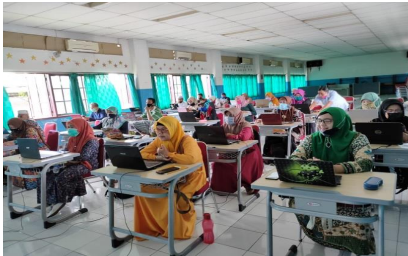
Gambar 3. Suasana Saat Berlangsungnya Kegiatan Pelatihan