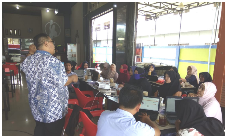
Gambar 4: Materi Submit Artikel Pada OJS 2020

Materi ke empat, mengenai peer review yang disampaikan oleh Arfriani Maifizar. Inti dari materi ini adalah bahwa sebuah naskah yang sudah masuk di akun section editor akan dikirimkan ke akun seorang reviewer berdasarkan keahliannya. Seorang reviewer bisa jadi tidak akan mengenali penulis naskah, lantaran identitas penulis sudah dihilangkan