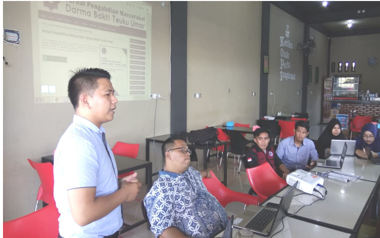
Gambar 3: Materi Pengenalan Jurnal Online di UTU 2020