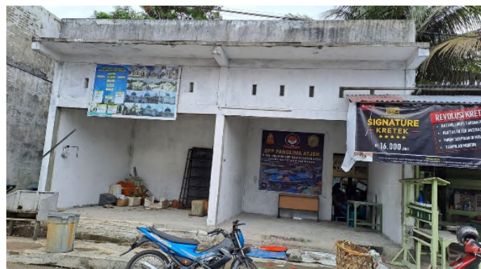
Gambar 1. Sekretariat Mitra Rumoh Nelayan Aceh

Mitra sasaran dalam program ini adalah kelompok nelayan di Kecamatan Johan Pahlawan, yang tergolong dalam kategori ekonomi produktif. Kelompok nelayan ini bernama Rumoh Nelayan Aceh seperti ditunjukkan pada Gambar 1.