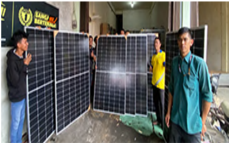
Gambar 5. Panel Surya 410WP

memanfaatkan energi terbarukan dari sinar matahari (Burhandono et al., 2022). Panel surya berhasil terpasang sebanyak 7 (tujuh) unit dengan spesifikasi masing-masing 410 WP, jumlah sel 108 pcs, berat 21,5 kg, tegangan maksimal 30,95 Volt, arus maksimal 13,25 A, module efficiency 21%. Cukup handal untuk mengoperasikan pompa dengan daya 180W DC. Panel surya yang digunakan seperti ditunjukkan pada Gambar 5.