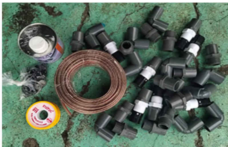
Gambar 10. Komponen Pendukung

panel surya mc4 Twin Kabel 2x2.5mm 2 , kabel Listrik, sock pvc, elbow pcv, pipa pvc, dan lain sebagainya.