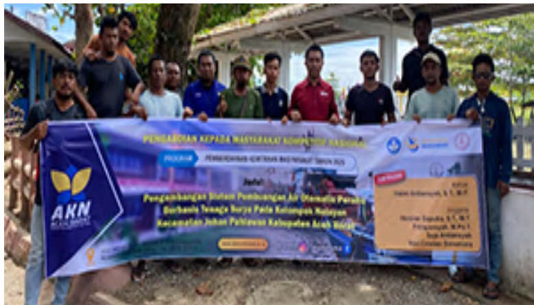
Gambar 3. Sosialisasi kegiatan pengabdian kepada masyarakat

Terdapat beberapa kendala yang selama ini dihadapi oleh para nelayan diantaranya masih banyan perahu yang menggunakan pompa pembuangan air bertenaga bahan bakar solah, bahkan banyak diantara mereka yang masih menggunakan pompa tantang manual pada saat membuang air yang masuk pada perahu. Oleh karena itu tim pengabdian yang terdiri dari 7 orang dosen dan 2 orang mahasiswa berpeluang untuk memberikan solusi atas permasalahan utama yang disampaikan oleh mitra.