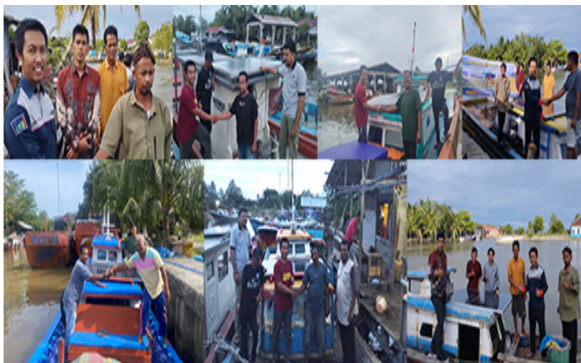
Gambar 12. Proses Serah Terima Barang

tergabung ke dalam asosiasi Rumoh Nelayan Aceh. Setelah melakukan penandatanganan Berita Acara Serah Terima, peralatan tersebut sepenuhnya menjadi milik masyarakat Rumoh Nelayan Aceh. Adapun dokumentasi penyerahan seperti pada Gambar 12.