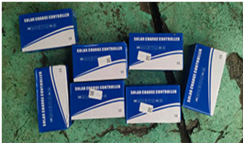
Gambar 9. Solar Charge Controller 30A

melindunginya dari kerusakan akibat pengisian berlebih (overcharge) atau pengosongan total (over-discharge), yang dapat memperpendek usia baterai. SCC yang sudah dipasang pada perahu berkapasitas 30A seperti yang ditunjukkan Gambar 9 (Trisna et al., 2019).