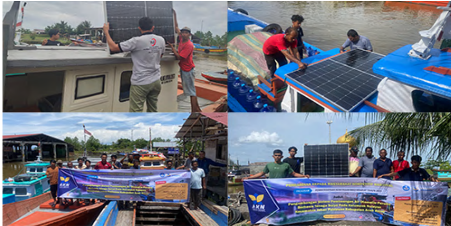
Gambar 11. Pemasangan Alat

Perangkat atau komponen sistem pembuangan air otomatis perahu nelayan secara keseluruhan telah terpasang pada 7 (tujuh) perahu. Sistem juga telah melewati proses pengoperasian dan pengujian alat. Keseluruhan alat beroperasi dengan baik dan telah dilakukan edukasi tentang penggunaan alat dan pemeliharaan secara mandiri. Adapun beberapa dokumentasi pemasangan alat ditunjukkan pada Gambar 11.