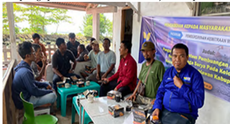
Gambar 4. Pelatihan pengoperasian alat

bagi mitra yang terdiri dari 7 (tujuh) kelompok nelayan. Pada kegiatan ini disampaikan penjelasan mendetail tentang pemanfaatan dan penggunaan masing-masing alat yang terpasang pada sistem pembuangan air perahu ini. Kegunaan dan fungsi masing-masing komponen juga dipaparkan secara mendalam dengan harapan para nelayan sudah mahir dalam menggunakan alat tersebut dalam menunjang kegiatan melaut. Pada sesi terakhir merupakan diskusi antara pemateri dalam hal ini disampaikan langsung oleh tim pengabdian dengan peserta pelatihan. Adapun kegiatan pelatihan seperti ditunjukkan pada Gambar 4.