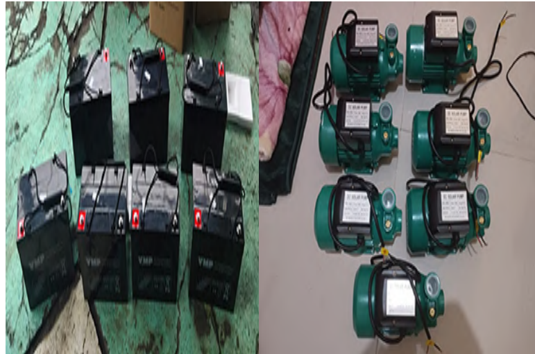
Gambar 7. AKI 12V50Ah dan Pompa Air DC

arus sebesar 50 ampere selama satu jam, atau arus yang lebih kecil untuk durasi yang lebih lama (Alhidayat, 2021). Pada keadaan full charged AKI ini dapat menghidupkan pompa air DC 180 Watt selama 3,33 jam secara terus menerus.