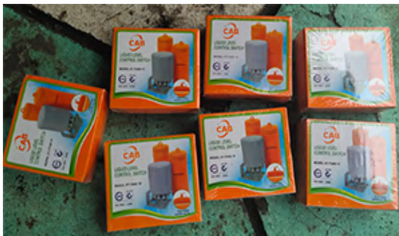
Gambar 8. Water Level Switch

dalam hal ini adalah perahu nelayan. Perangkat ini beroperasi seperti saklar biasa: ia akan menghidupkan atau mematikan aliran listrik tergantung pada posisi atau ketinggian air (Apriyanto, 2015).