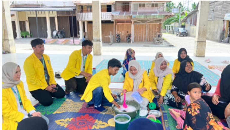
Gambar 2. Dokumentasi Proses Pembuatan Sabun Cuci Piring

Pelatihan praktik melibatkan seluruh 25 peserta secara aktif. Peserta dibagi ke dalam lima kelompok kecil (masing-masing 5 orang) untuk memastikan setiap anggota mendapat kesempatan terlibat langsung dalam proses produksi. Setiap kelompok dipandu oleh satu anggota tim mahasiswa yang berperan sebagai fasilitator. Proses produksi berlangsung secara lancar, dan seluruh kelompok berhasil menghasilkan produk sabun cuci piring dengan karakteristik fisik yang baik: viskositas sedang, busa melimpah, dan warna serta aroma yang seragam. Dokumentasi proses pembuatan sabun tersaji pada Gambar 2.