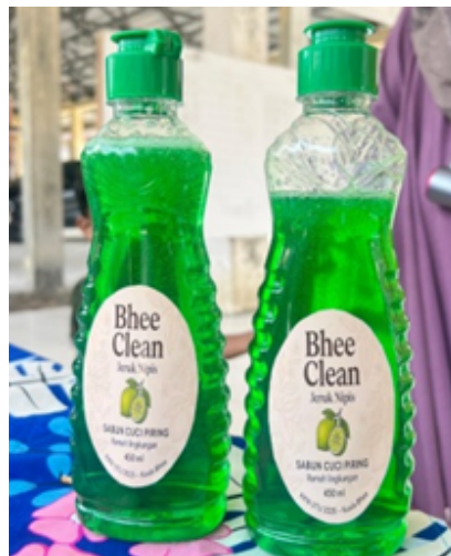
Gambar 3. Produk Akhir Sabun Cuci Piring dan Proses Pengemasan

Seluruh peserta berhasil melakukan pengemasan produk secara mandiri. Produk akhir berupa sabun cuci piring dalam botol 450 ml dengan label yang memuat identitas produk. Beberapa peserta menunjukkan kreativitas dalam desain label, mencerminkan motivasi intrinsik untuk mengembangkan produk sebagai usaha komersial. Produk akhir dan tahapan pengemasan tersaji pada Gambar 3.