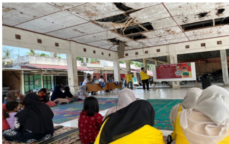
Gambar 1. Dokumentasi Penyampaian Materi Sosialisasi

Sesi sosialisasi direspons dengan sangat positif oleh peserta. Antusiasme masyarakat terlihat dari tingginya intensitas pertanyaan dan aktifnya diskusi kelompok sepanjang sesi berlangsung. Masyarakat menunjukkan rasa ingin tahu yang tinggi terhadap aspek kewirausahaan, khususnya terkait perhitungan keuntungan dan strategi pemasaran produk sabun. Dokumentasi sesi sosialisasi dan penyampaian materi tersaji pada Gambar 1.