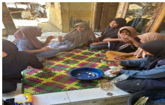
Gambar 2. Dokumentasi Kegiatan Pelatihan Pembuatan Kecap Manis Air Kelapa