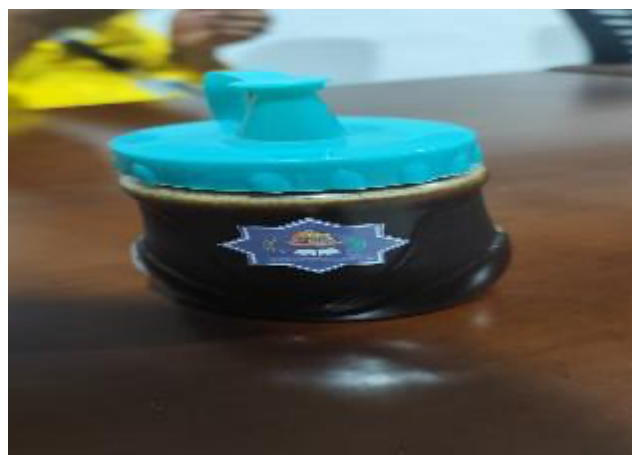
Gambar 3. Hasil Olahan Kecap Manis Dari Air Kelapa