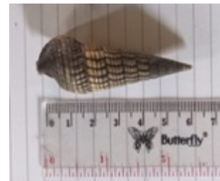
f. Cerithidea obtuse