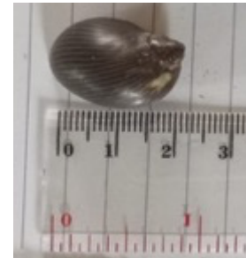
i. Vittina turrita