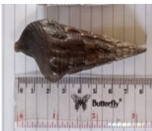
a. Telescopium telescopium

Hasil penelitian ini diperoleh 9 jenis dari 6 famili gastropoda yaitu Potamididae , Columbellidaes , Cerithiidae , Strobidae , Olividae , Neritidae . Salinitas adalah salah satu faktor yang sangat berpengaruh bagi kelompok Gastropoda dan keberadaan hutan mangrove, untuk saat ini hasil yang diperoleh di kawasan pengamatan salinitas pada setiap Stasiun I 30,2%, Stasiun II 33,5% dan Stasiun III 33,7%.