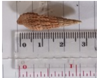
e. Ceritium scabridum