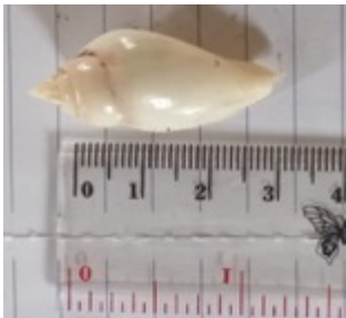
g. Strombus turturella