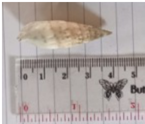
d. Ceritium fasciata