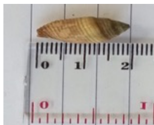
b. Parvanacis obes