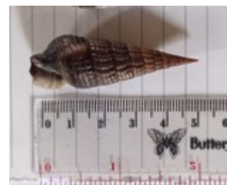
c. Terebralia semistriata