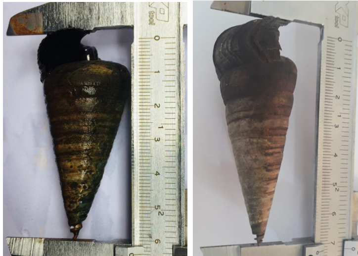
Gambar 2. Telescopium telescopium

Hasil perhitungan analisis karakteristik dan morfometrik pada stasiun I, II dan III mempunyai nilai yang berbeda-beda (Tabel 2). Panjang, lebar dan berat suatu cangkang. Akan tetapi berdasarkan kelas ukuran termasuk dalam kategori ukuran kecil (4,70 – 6,53 cm).